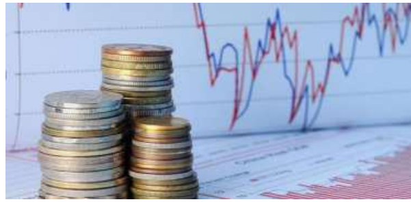
BETTER YIELDS. Total traded volume in the aforementioned instruments soared 295 per cent y-o-y to ₹9,167 crore

Primary market subscriptions (cumulative) for financial instruments such as treasury bills, floating rate savings bonds, Central G-